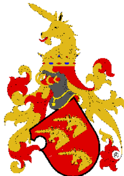
Parish ze Senftenbergu

Od roku 1809 do roku 1815 byl majitelem hradu Litice nad Orlicí u Vamberku Veriand Alfred hrabě Windisch-Graetz (vyobrazení knížecího erbu).