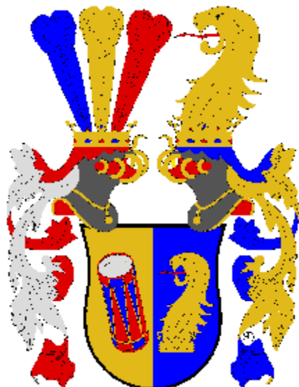
Bubna z Litic

(Vyobrazení ve větším rozlišení později naleznete na http://heraldika.drozd.info/hag/vamberk.htm ).