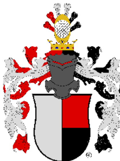
Hrzánové z Harasova

Od roku 1562 do roku 1948 drželi a po roce 1989 až dosud drží panství Doudleby nad Orlicí u Vamberku hrabata Bubnové z Litic.