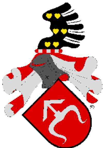
Tvorkovský z Kravař

(Barevná vyobrazení později naleznete na http://heraldika.drozd.info/hag/napajedla.htm ).