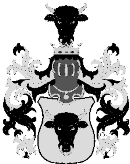
Pernštejnové Držitelé města od roku 1505, resp. 1564.