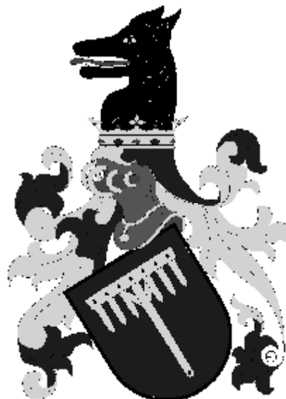
Kostkové z Postupic Držitelé města od roku 1432.